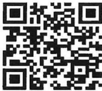
QR Code กรอกข้อมูล

สำรวจความต้องการฉีดวัคซีนโรคพิษสุนัขบ้า (Pre-exposure) ให้กับเจ้าหน้าที่กรมปศุสัตว์และอาสาปศุสัตว์