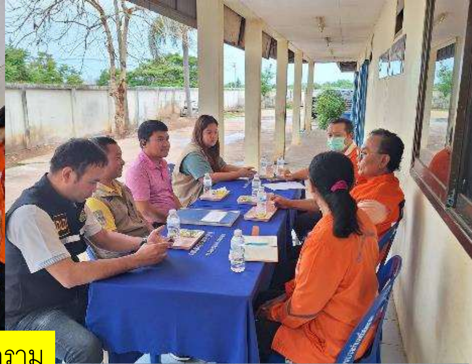
ศรีสงคราม