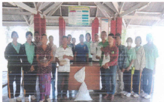
๔.๑.๒ ภาพติดตาม...